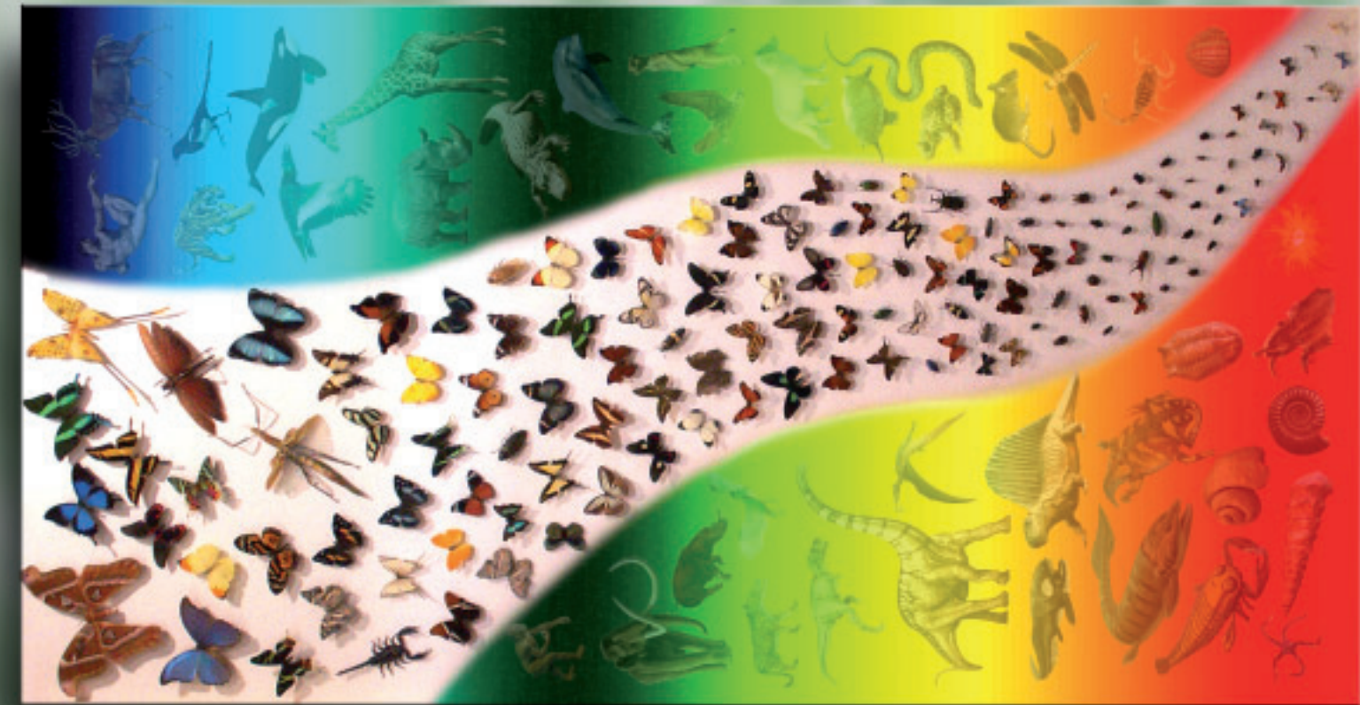
225 X 122 cm