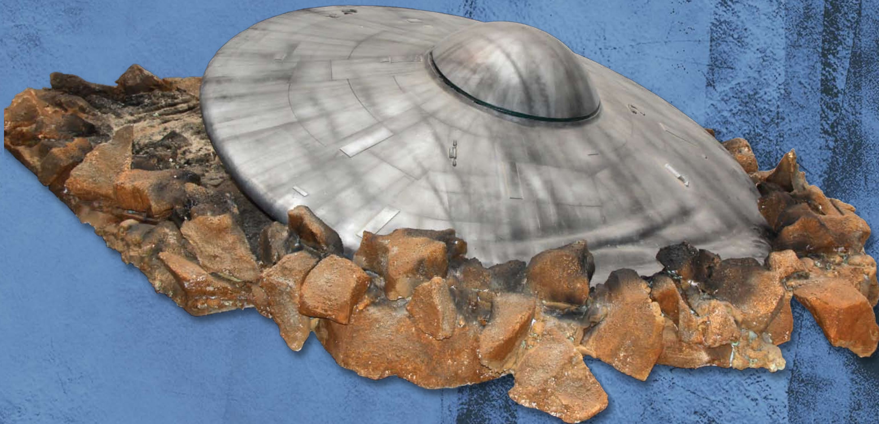
Escena de OVNI estrellado (3,60x1,40m.)