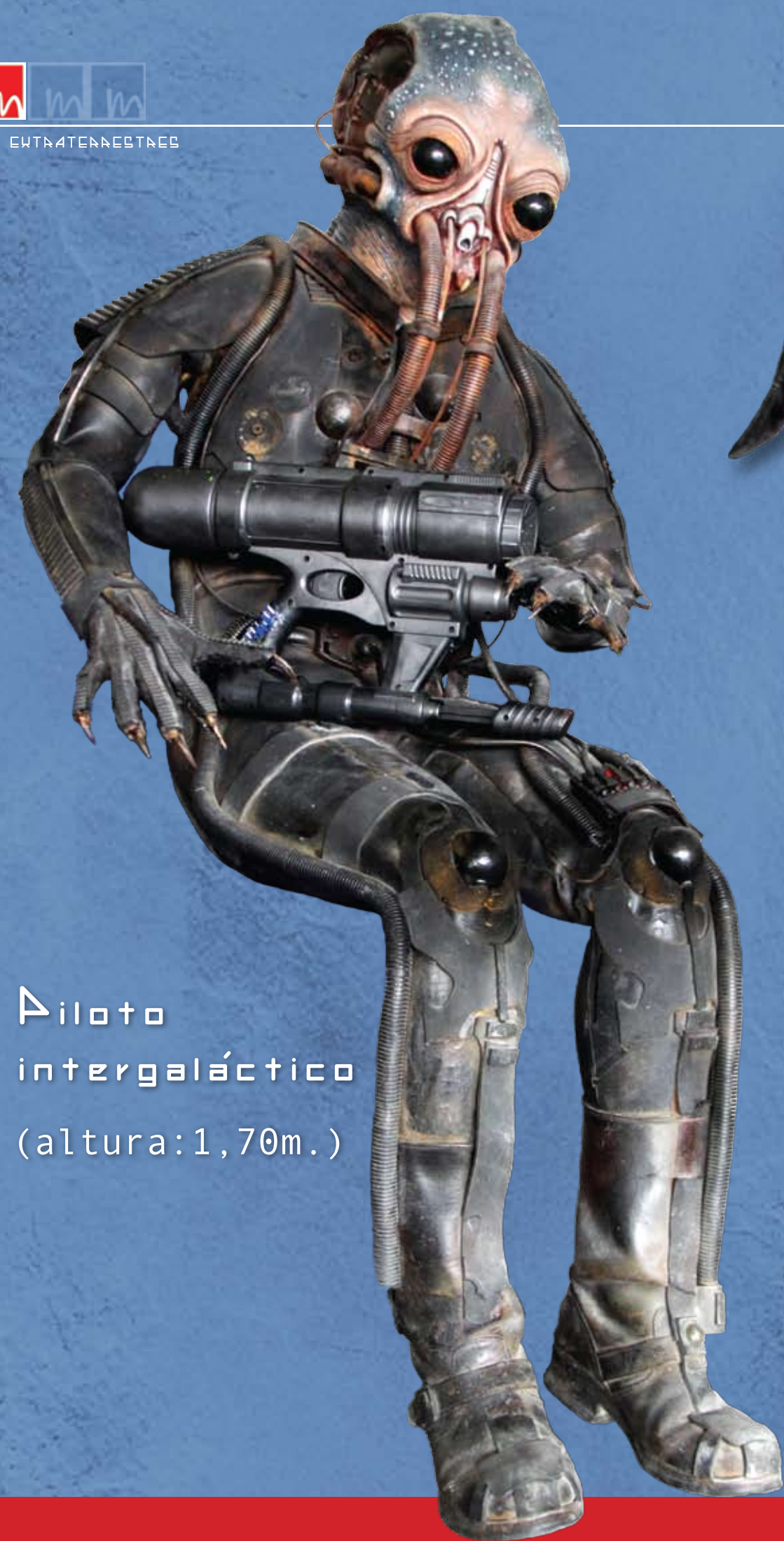
Piloto intergaláctico (altura:1,70m.)