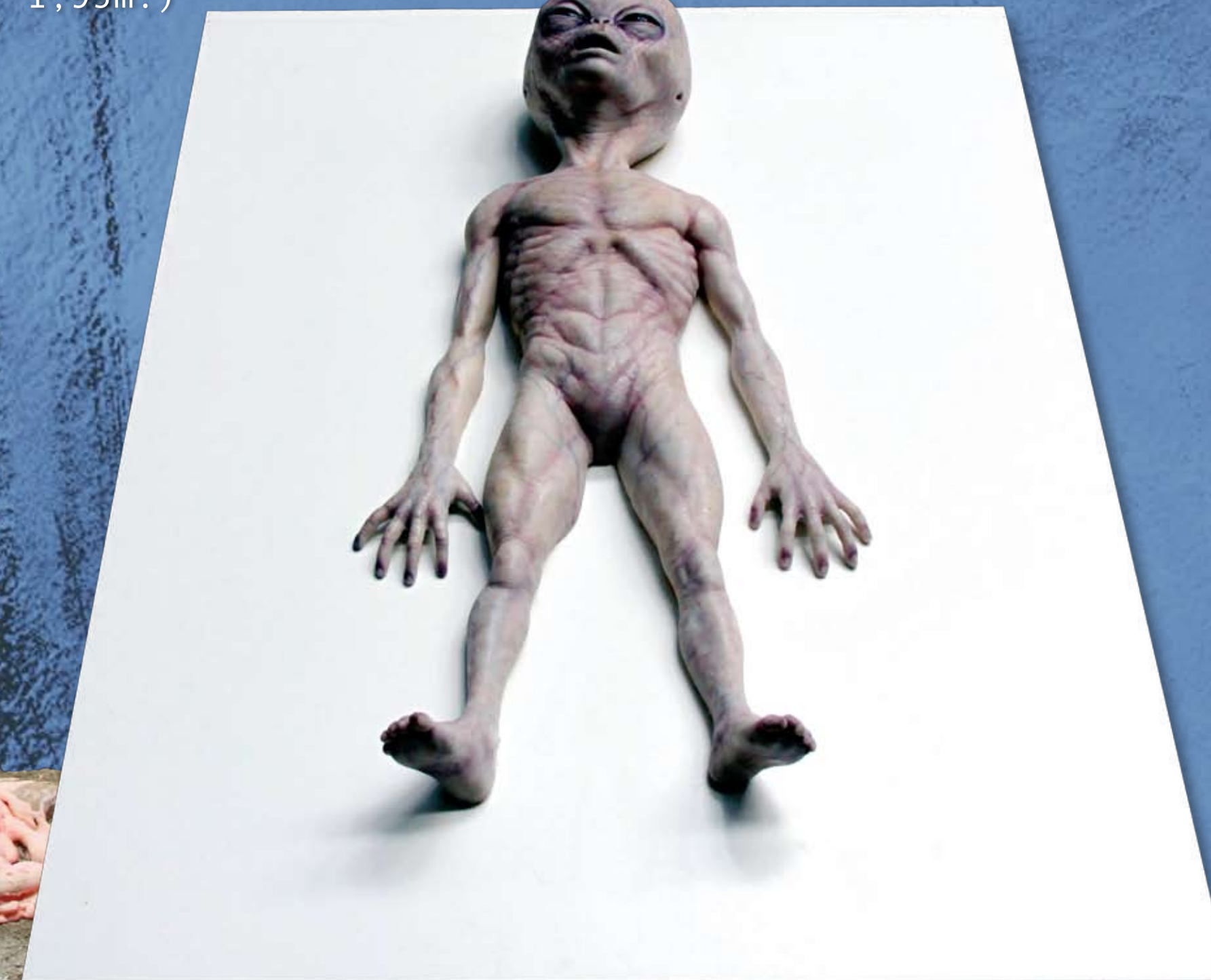
Alien gris de Roswell (1,20x0,90m.)