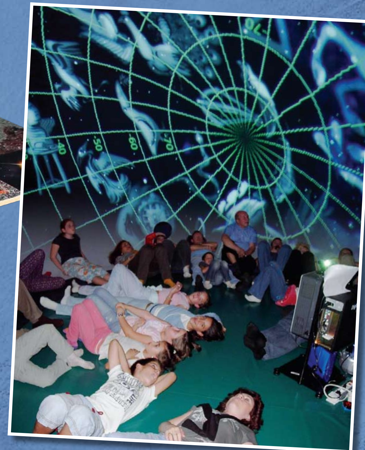
(6m.de diámetro y 4 m. de altura)